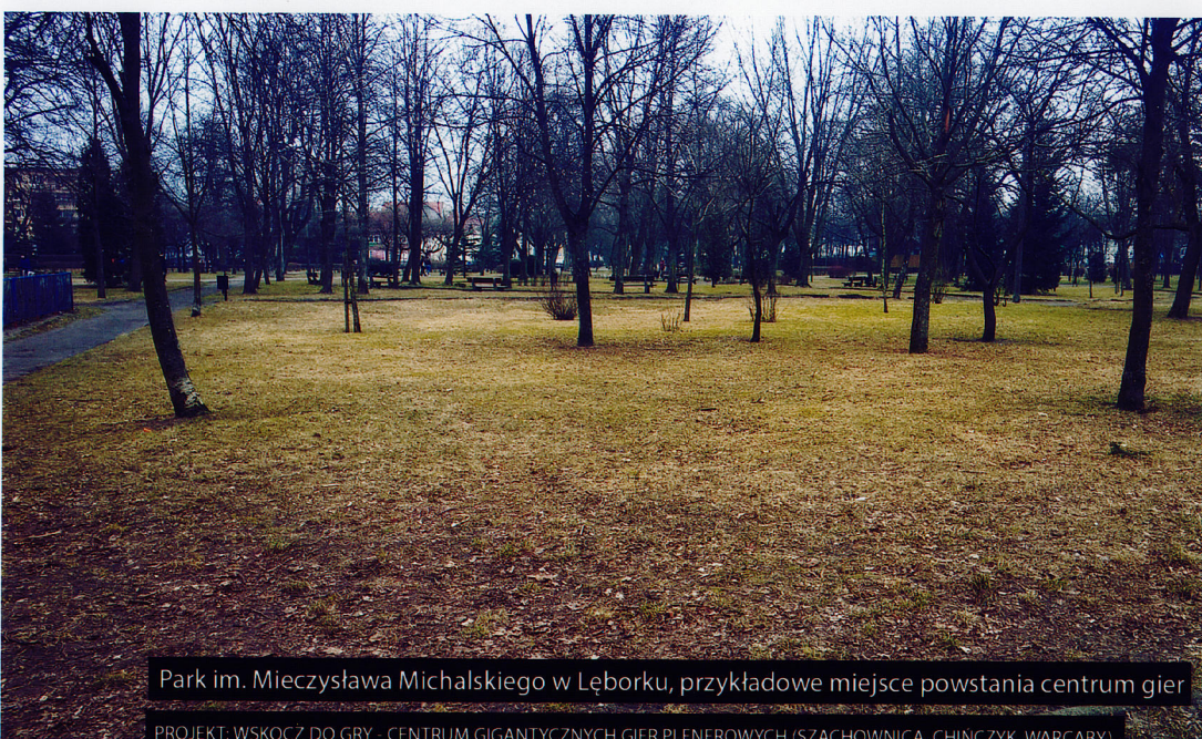
Park im. Mieczysława Michalskiego w Łęborku, przykładowe miejsce powstania centrum gier

PROJEKT: WSKOCZ DO GRY - CENTRUM GIGANTYCZNYCH GIER PLENEROWYCH (SZACHOWNICA, CHINCZYK, WARCABY)