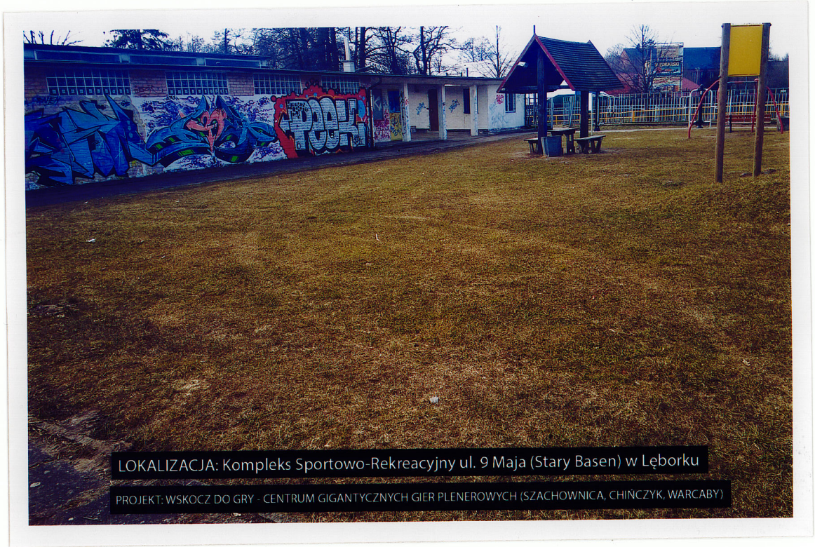
LOKALIZACJA: Kompleks Sportowo-Rekreacyjny ul. 9 Maja (Stary Basen) w Łęborku