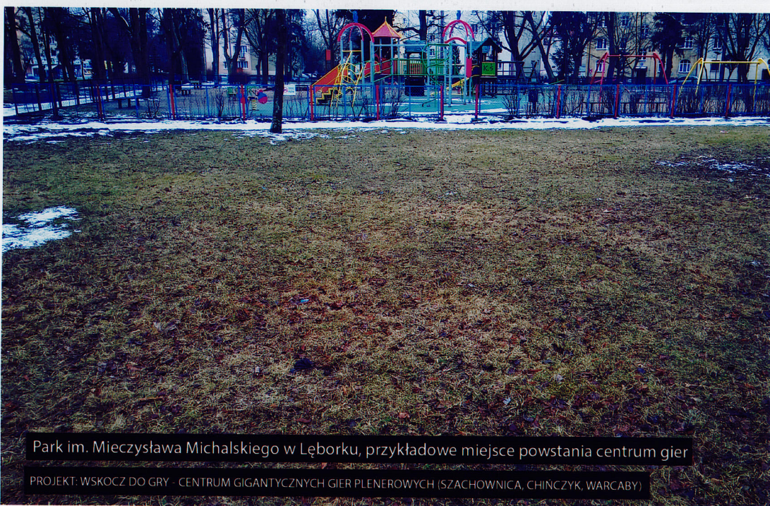
Park im. Mieczysława Michalskiego w Łęborku, przykładowe miejsce powstania centrum gier

PROJEKT: WSKOCZ DO GRY - CENTRUM GIGANTYCZNYCH GIER PLENEROWYCH (SZACHOWNICA, CHINCZYK, WARCABY)