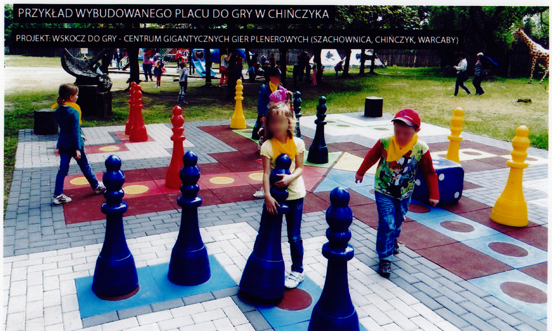
PRZYKŁAD WYBUDOWANEGO PLACU DO GRY W CHINCZYKA

PROJEKT: WSKOCZ DO GRY - CENTRUM GIGANTYCZNYCH GIER PLENEROWYCH (SZACHOWNICA, CHINCZYK, WARCABY)