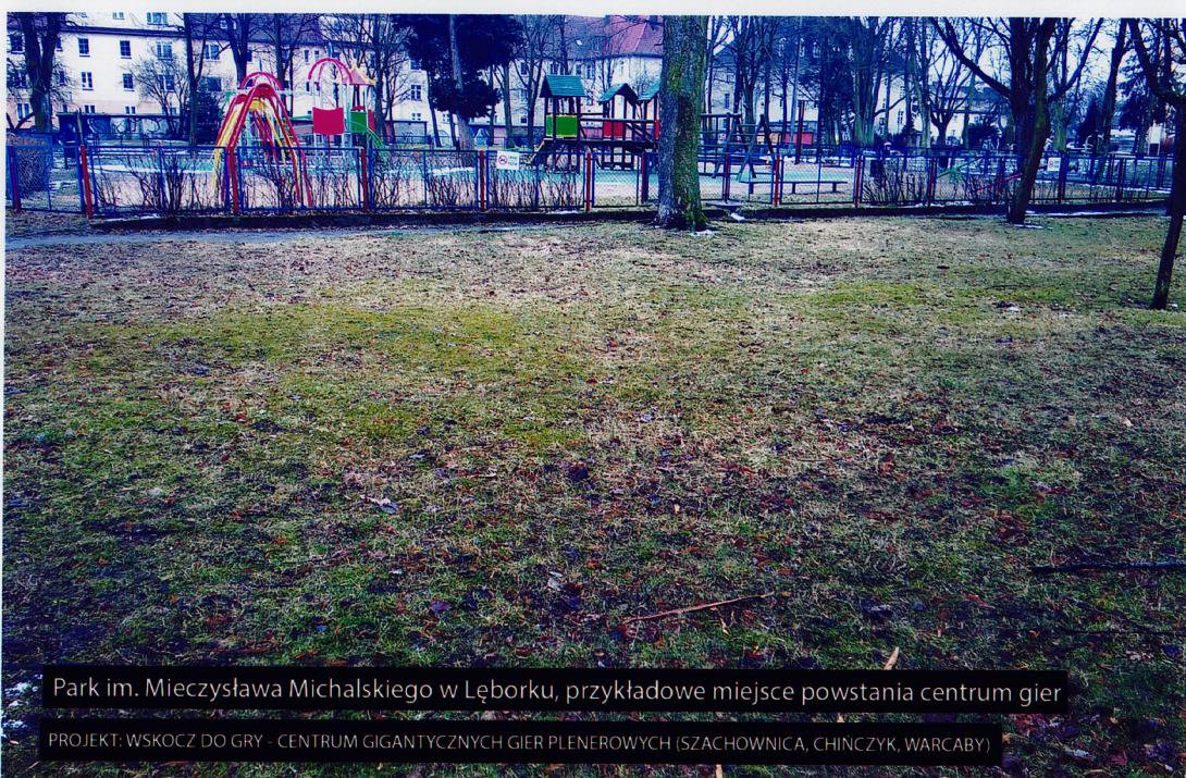
Park im. Mieczysława Michalskiego w Łęborku, przykładowe miejsce powstania centrum gier

PROJEKT: WSKOCZ DO GRY - CENTRUM GIGANTYCZNYCH GIER PLENEROWYCH (SZACHOWNICA, CHINCZYK, WARCABY)