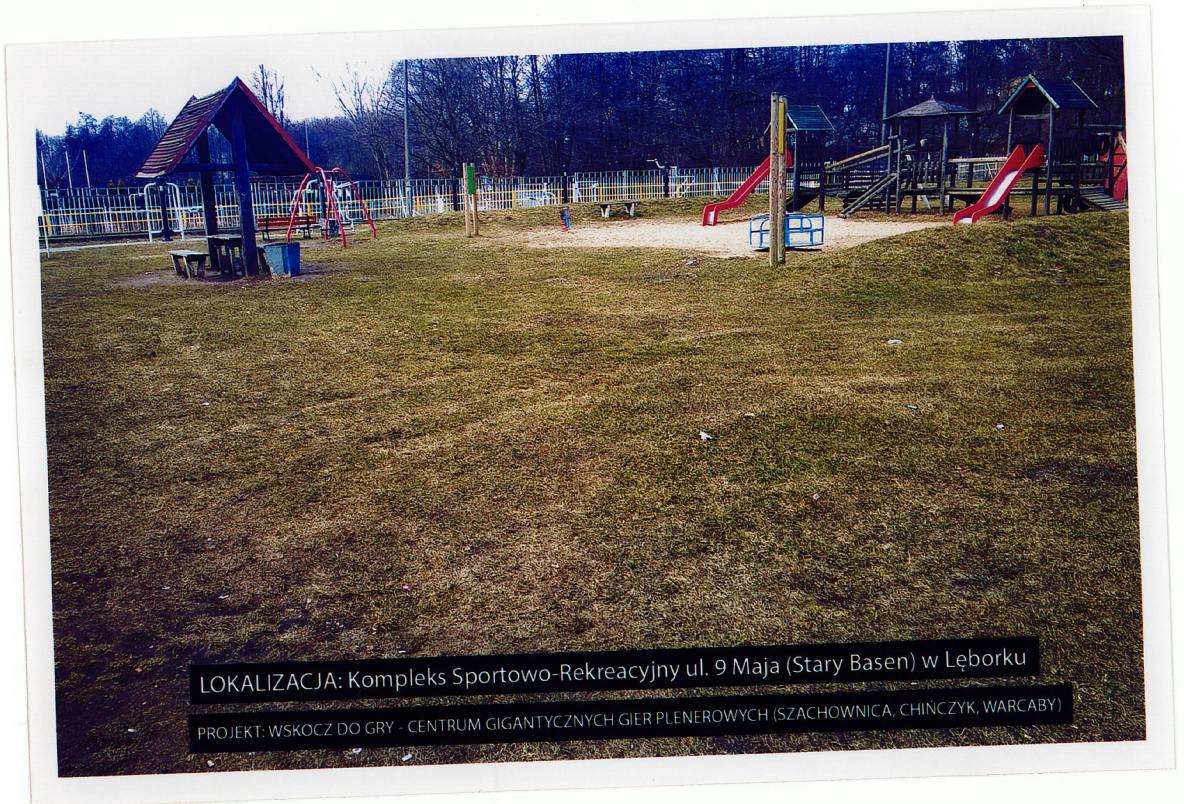
LOKALIZACJA: Kompleks Sportowo-Rekreacyjny ul. 9 Maja (Stary Basen) w Łęborku