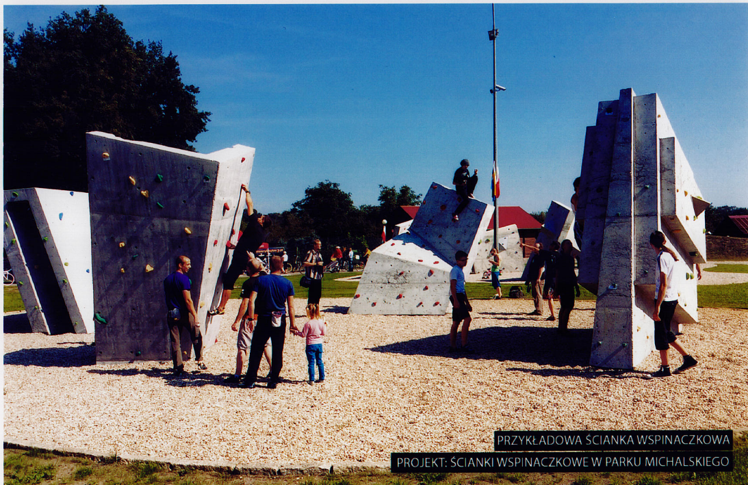
PRZYKŁADOWA ŚCIANKA WSPINACZKOWA PROJEKT: ŚCIANKI WSPINACZKOWE W PARKU MICHAŁSKIEGO