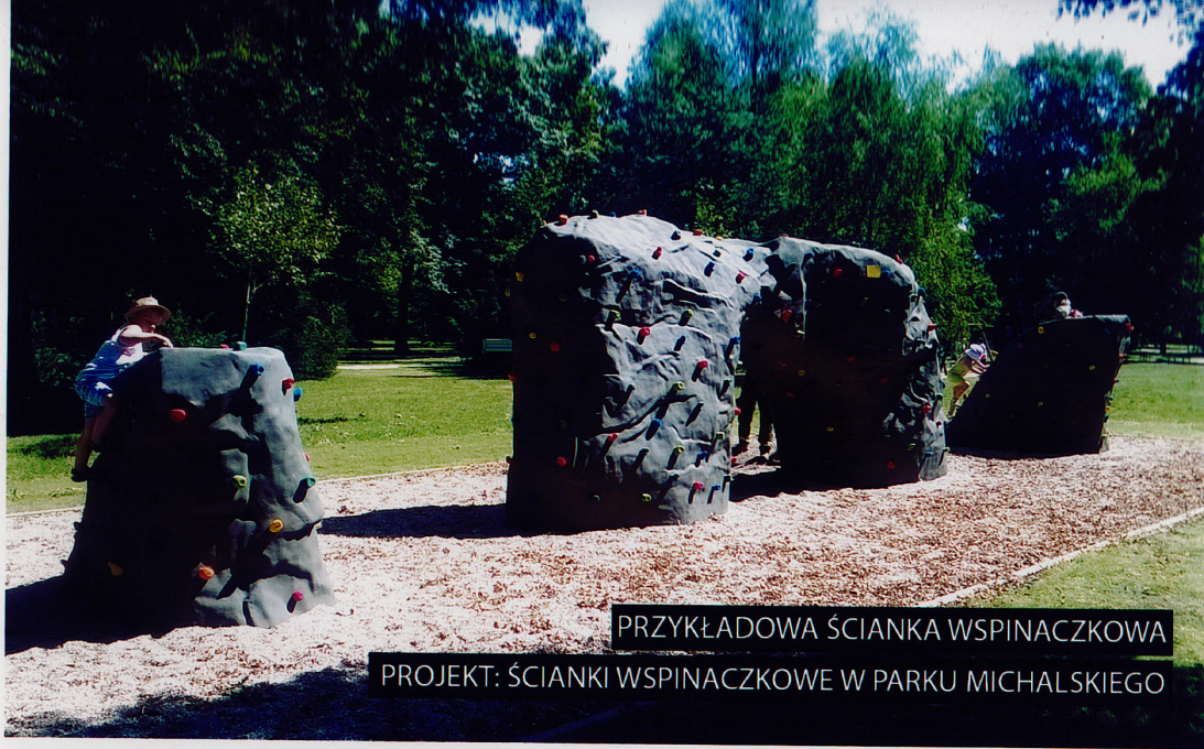
PRZYKŁADOWA ŚCIANKA WSPINACZKOWA PROJEKT: ŚCIANKI WSPINACZKOWE W PARKU MICHAŁSKIEGO